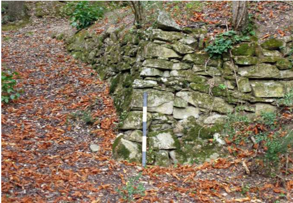
Photo d'un ancien confluent sur Roumengade